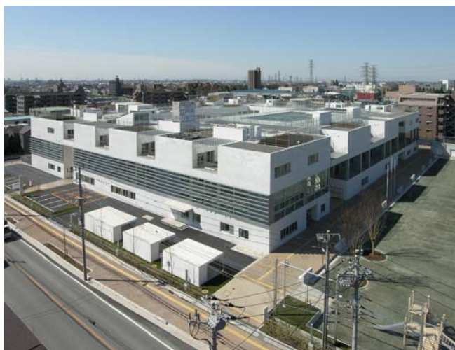
戸田市立芦原小学校等複合施設