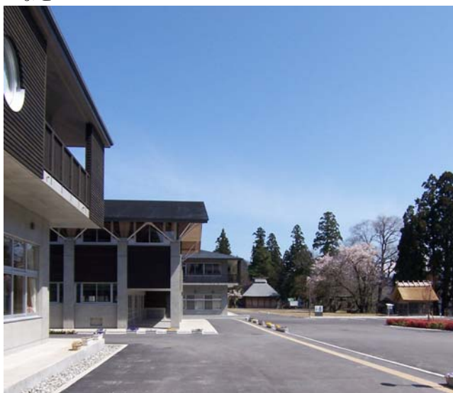
小谷村立小谷小学校